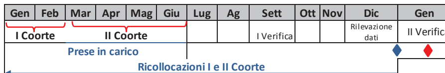
Immagine 2_Seconda Verifica