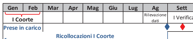
Immagine 1_Prima Verifica

A titolo esemplificativo si riporta una rappresentazione della prima e della seconda verifica, per coorti :