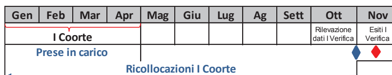
Immagine 1_Prima Verifica

A titolo esemplificativo si riporta una rappresentazione della prima e della seconda verifica, per coorti: