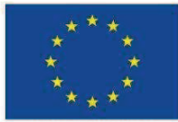
Unione europea Fondo sociale europeo